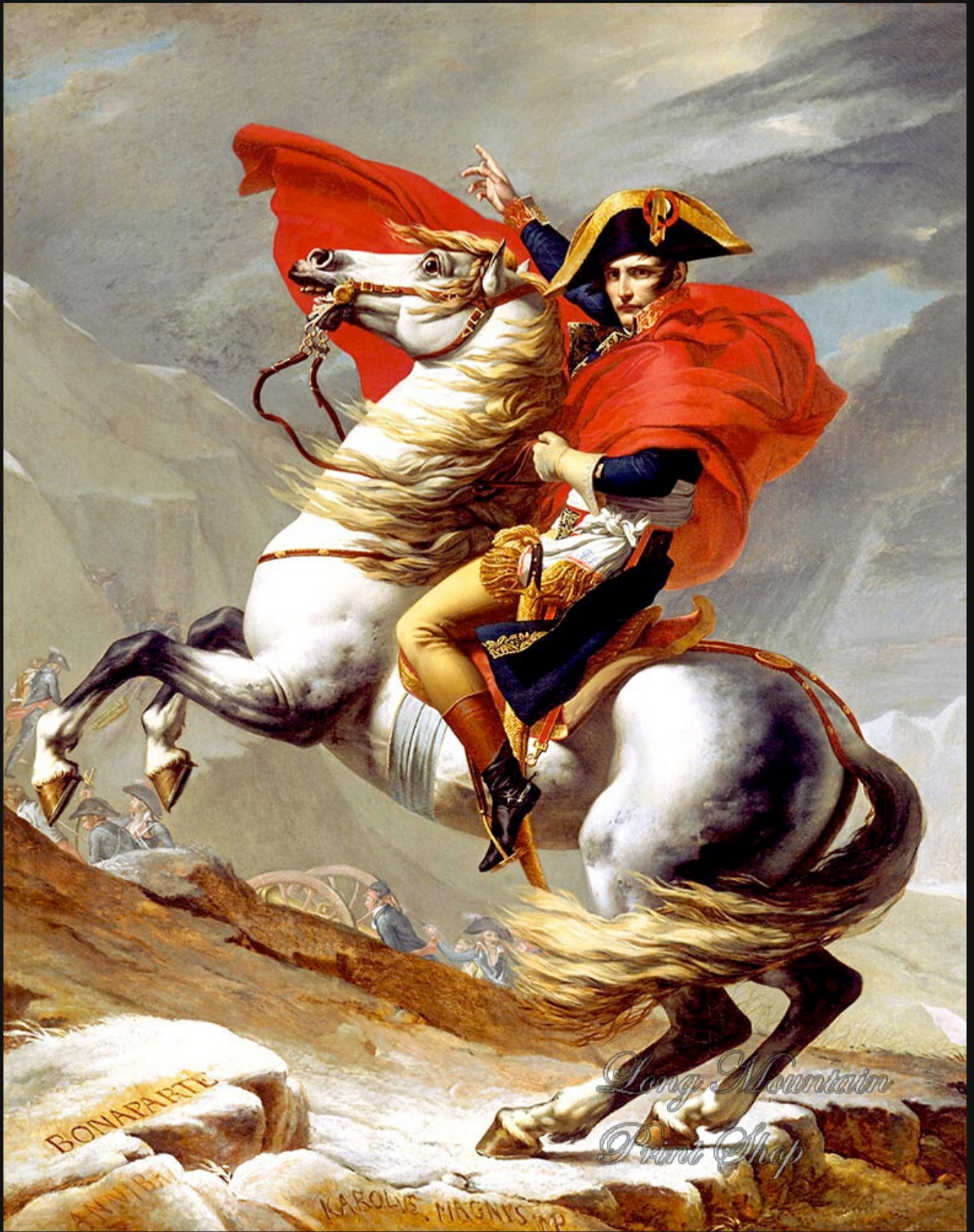
Napoleón cruzando Los Alpes Jacques-Louis David