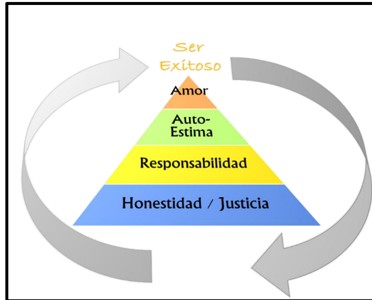
Figura 2. Modelo Pedagógico basado en valores. Modelo piramidal propio del Colegio Los Próceres.

Al rescate de los valores perdidos para vivir dignamente y convivir pacíficamente CÓDIGO DANE: 354001006530 / RESOLUCIÓN 001173 de 23 de Agosto de 2007